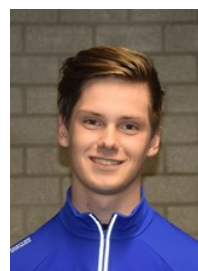
Fonteyn Branbergen Heiloo 15 jaar Junior B1